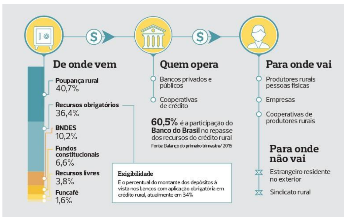
Figura 1: Como funciona o crédito rural brasileiro.

Na Figura 1 abaixo podemos verificar de onde vem esses recursos, quem os opera e para quem são disponibilizados e, na Figura 2, quais são os objetivos, as condições para que o produtor possa se beneficiar desses recursos e quais são as diferentes modalidades de utilização.